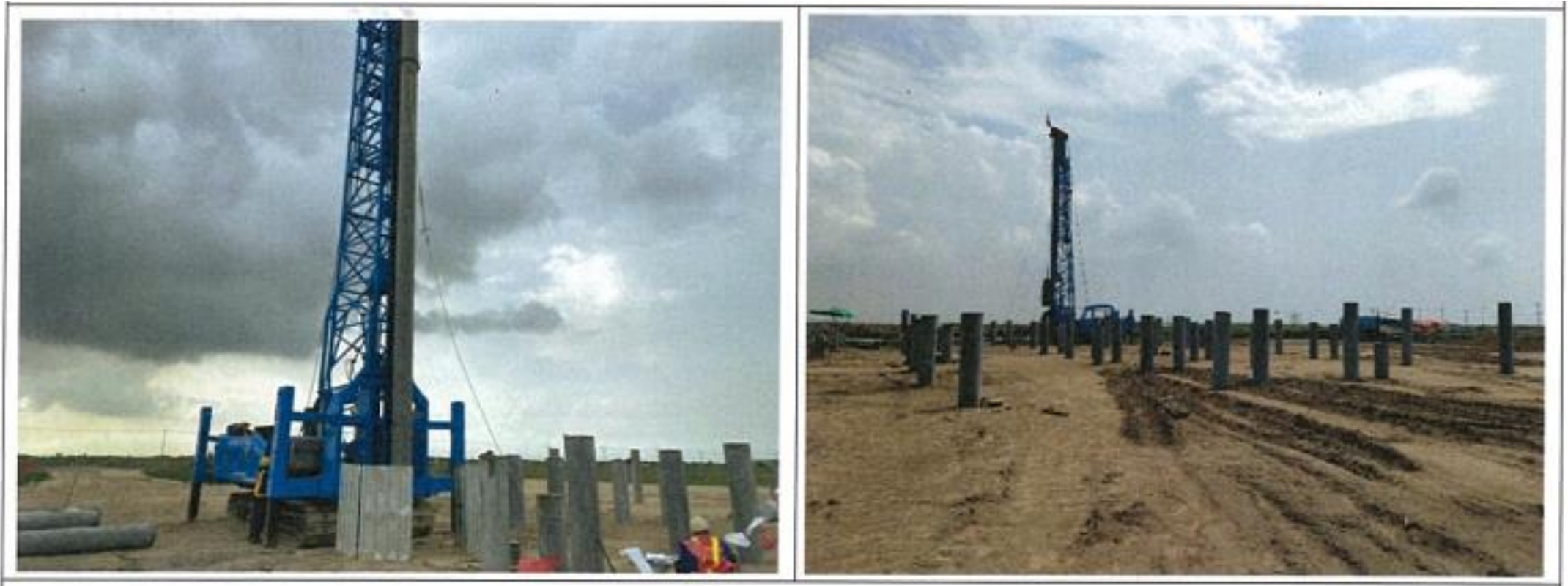
งาน Structural works AGL 02L