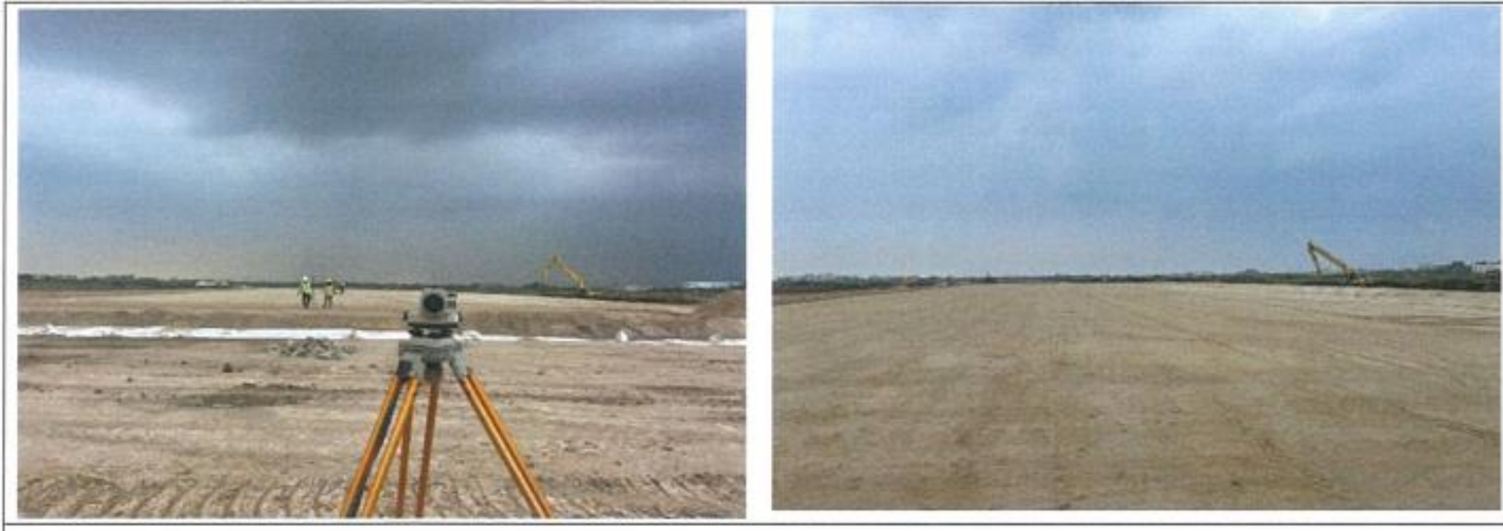
งาน Sand Blanket : North