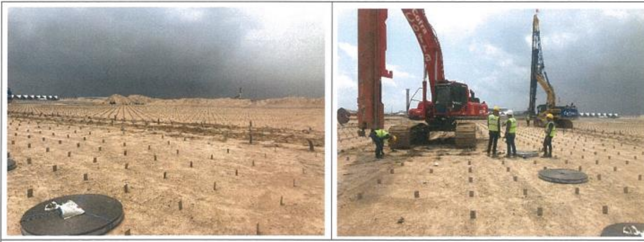
งาน Installation PVD : North Area