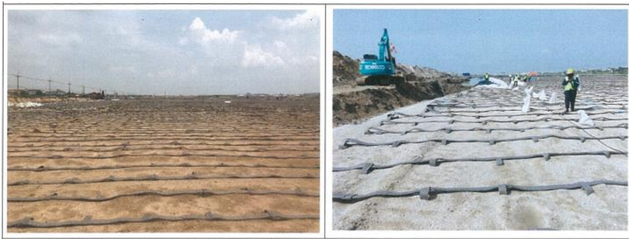
งาน Installation PHD : North Area