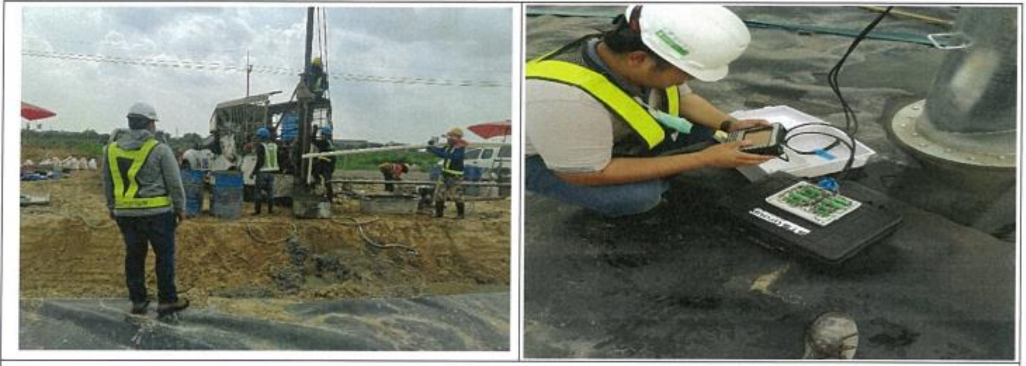
งาน Installation of monitoring Instrumentation