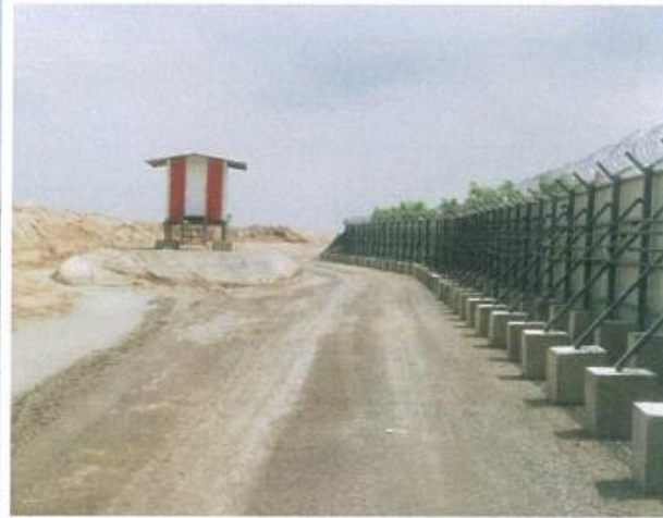
งานรั้วชั่วคราว