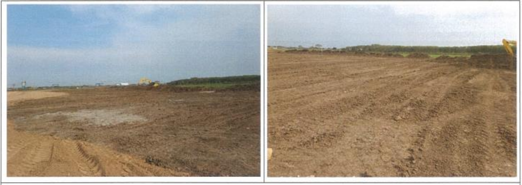
งาน Clearing – Extension D-2